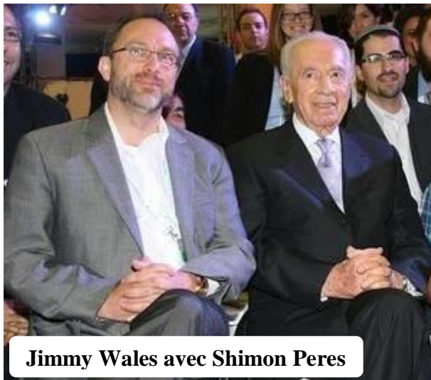
Jimmy Wales avec Shimon Peres

Bien sûr, il y a des conférences annuelles de Wikipédia Academy depuis 2009, où les Israéliens reçoivent une formation Wikipedia et un soutien. Et bien sûr, des groupes tels que CAMERA , une organisation de relations publiques pro-sioniste en Israël, ont activement édité Wikipédia depuis au moins 2008. Et bien sûr, Israël a activement financé hasbara sur Internet depuis des années et n'est pas timide sur sa " diplomatie numérique ". Il y a même une " Ligue juive de défense Internet " qui prétend être l' " avant garde du plaidoyer pro-israélien sur Internet ". Après tout, le besoin déclaré de campagnes de promotion nationales incessantes s'inscrit dans le thème " nous sommes ceux qui sont attaqués ".